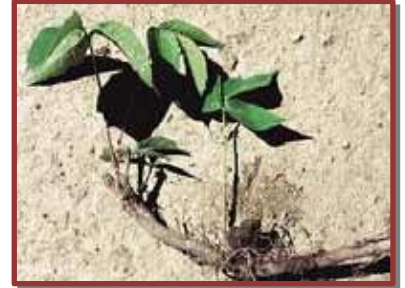
Parties aériennes et rhizomes