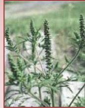
Herbe à poux

Il ne faut pas confondre l'herbe à la puce et l'herbe à poux. Le pollen de cette dernière est la principale cause de rhinite allergique saisonnière, communément appelée rhume des foins. Contrairement à l'herbe à la puce, on peut sans danger arracher l'herbe à poux à mains nues.