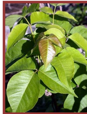
Herbe à la puce

L'herbe à la puce appartient à la famille des Anacardiaceae, la même famille que le pistachier et le manguier. Des quatre espèces de la famille des Anacardiaceae retrouvées au Québec, trois causent des irritations, soit l'herbe à la puce, le sumac à vernis et le sumac aromatique ). La quatrième, le sumac vinaigrier, est un arbuste coloré en automne, qui ne cause aucune inflammation.