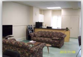
Salon des aînés