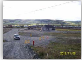
Développement du Vallon