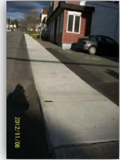
Trottoirs côte Taschereau