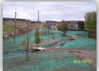
Parc des générations